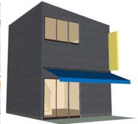
建物イメージパース